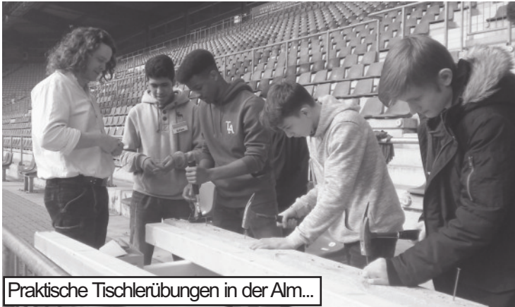
Praktische Tischlerübungen in der Alm...

Für die REGE mbH liegt dabei der besondere Fokus auf dem Thema Berufsorientierung. In der Schüco Arena arbeiten nicht nur Fußballer und Geschäftsleute, sondern auch Handwerks- und Dienstleistungsbetriebe geben sich hier täglich die Klinke in die Hand. Ausgewählte Betriebe geben vor Ort Einblick in ihre Berufe, für Jugendliche ein spannender Zugang zur Berufswelt - und eine Hilfe zur Berufsfindung.