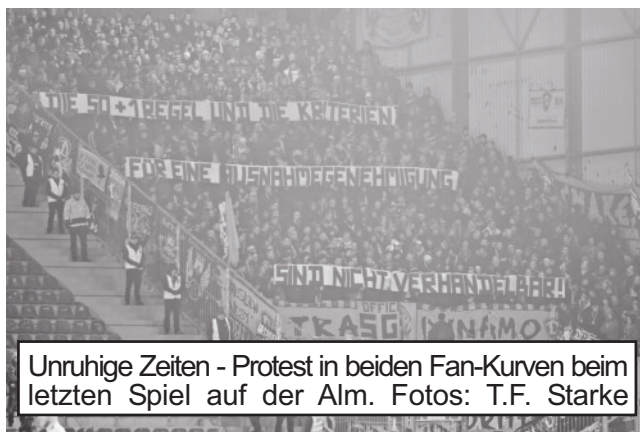
Unruhige Zeiten - Protest in beiden Fan-Kurven beim letzten Spiel auf der Alm.

Entscheidungen des Clubs am Ende die Mitglieder darüber entscheiden dürfen und müssen. Sie haben immer mindestens eine Stimme mehr als mögliche Anteilseigner. Diese Regel ist aber schon mehrmals aufgeweicht worden. Es gibt den Passus, dass langjährige Finanziere (mind. 20 Jahre), die den Verein in „erheblichem Umfang“ gefördert haben, einen Sonderstatus haben. Diese Regel musste man seinerzeit bei der DFL-Gründung einführen, damit Vereine wie Bayer Leverkusen eine Lizenz kriegen konnten. Auf dieser Sonderregelung basieren auch die Genehmigungen von Hoffenheim und letztlich auch Leipzig. Spätestens letzterer Fall hat auch Herrn Kind, langjähriger Sponsor von Hannover 96, auf den Plan gerufen. RB persifliert schon fast die Lizenzvergabe, der Verein hat ganze 17 Mitglieder und der Brausehersteller allein das Sagen. Herr Kind hat u.a. genau deshalb geklagt, weil sich sein langes Engagement bei weitem mehr mit der ursprünglichen 50+1-Regel deckt als das des österreichisch-