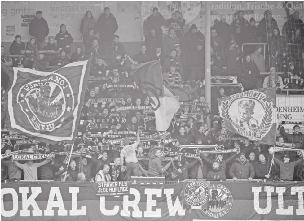
Lautstarke Unterstützung des DSC in nah und fern. Nach Heidenheim sind's über'n Daumen 480 km...

Auswärtsspiele in Heidenheim stellen nicht gerade ein Saisonhighlight dar. So auch dieses Mal. 440 Arminen nahmen dennoch die Anreise auf sich, um ihr Team nach der Heimmiederlage gegen Dresden wieder aufzubauen. Die DSC-Elf konnte sich auf eine 90minütige Unterstützung verlassen und zeigte ihrerseits eine große Moral. Mit dem Last-Minute-Ausgleich hielt der Tag immerhin einen besonders schönen Fußball-Moment bereit und setzte bei Spielern, Trainer und Fans eine ordentliche Ladung Emotionen frei. Die Fanszene des FC Heidenheim äußerte Kritik an der leidigen Spieltagszerstückelung. Ohne weitere Vorkommnisse ging es nach Schlusspfiff schnellstmöglich zurück nach OWL.