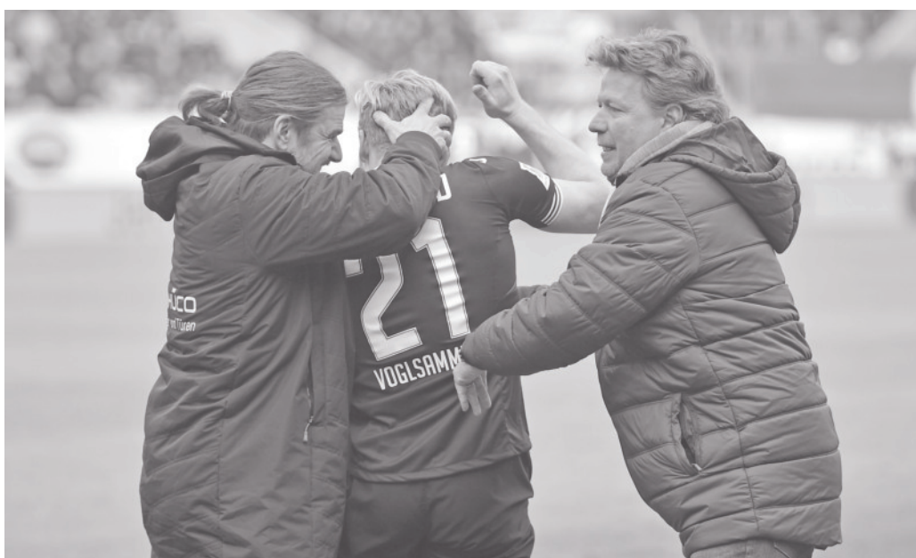
2:2, Voglsammer sei Dank! Die Arminen nehmen einen ganz wichtigen Punkt mit aus Heidenheim.

Die Überschrift passt weiterhin wie die Faust auf's Auge! Durch die Punkteausbeute des DSC sowie die Ergebnisse der anderen Vereine an den letzten Spieltagen ist klar, die berühmten 40 Punkte sind eben nicht das Maß aller Klassenerhaltungsdinge! Sondern eher Minimum, um gar nicht erst ins Hintertreffen zu geraten. Und doch, es ist mit den kommenden drei Spielen möglich, den Kontakt zu den Aufstiegsplätzen nicht abreißen zu lassen: heute Nürnberg, nächsten Freitag Düsseldorf, und Ostersonntag Kiel zuhause; die ersten drei der aktuellen Tabelle sind Arminias illustre Gegner in den kommenden Wochen! Daher sollte auch das Thema Klos-Einsatz gar nicht erst zu einer Krise heraufgeschwafelt werden, denn: entscheidend ist auf'm Platz! Auf geht's Arminia!