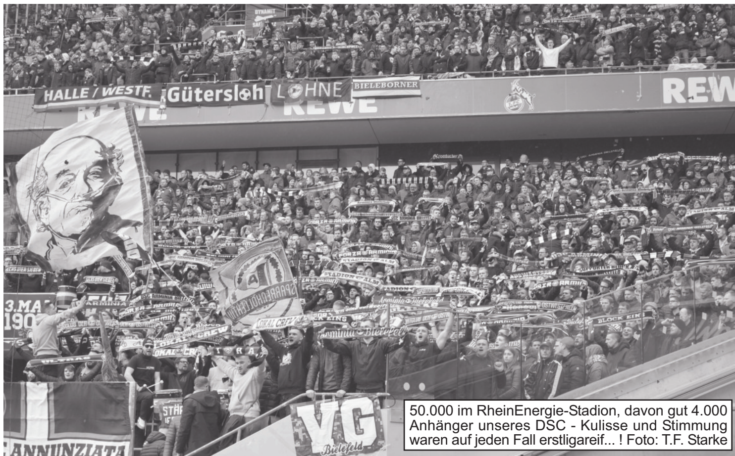
50.000 im RheinEnergie-Stadion, davon gut 4.000 Anhänger unseres DSC - Kulisse und Stimmung waren auf jeden Fall erstligareif... !

Der 1. FC Köln gilt als einer der Favoriten im Kampf um die Aufstiegsplätze. Leistungsschwankungen der Mannschaft sowie vor allem die internen Machtkämpfe innerhalb der Führungsetage des Clubs sorgten jedoch zuletzt für negative Schlagzeilen. Von Verunsicherung war im Heimspiel gegen unsere Arminia jedoch nichts zu sehen. 50.000 Zuschauer sahen ein torreiches Spiel, in dem der DSC leider vollkommen chancenlos war. Die Kölner Fanszene drückte mit Bezug auf die Querelen im Verein ihren Protest aus, konnte aber angesichts von fünf Toren die Karnevalsfeierlichkeiten verlängern. „Denn wenn et Trömmelche jeh“ hat die 4.000 mitgereisten Arminen vermutlich noch einige Zeit lang als unliebsamer Ohrwurm begleitet. Der Gästeblock legte trotz der hohen Niederlage jedoch einen spitzenmäßigen Auftritt hin und überzeugte durchgängig mit Lautstärke.