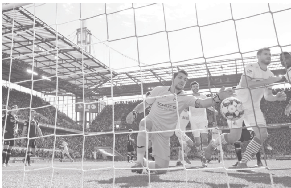
Nicht nur in dieser Szene das Nachsehen. Die Arminen erwischten einen schlechten Tag und liefen Köln zumeist hinterher.

In Köln war für Arminia nichts zu wollen. War im Hinspiel auf der Alm zeitweise noch ein Remis möglich, gab sich der Aufstiegs kandidat vom Rhein am letzten Wochenende gar keine Blöße. Da sollte es für den DSC nun schlicht heißen: „Mund abputzen, weitermachen“. Und mit dem westfälischen Nachbarn aus Bochum kommt heute ein Gegner auf die Alm, bei dem es keinerlei Motivationskünste braucht, um die Neuhaus-Elf heiß zu machen. Wenn der VfL kommt, ist Spannung garantiert! Zumal der Ruhrpott-Club nach einer längeren Durststrecke gerade einen, wenn auch etwas glücklichen, Dreier geholt hat, gegen niemand Geringeres als das auswärtsstarke Heidenheim. Derweil darf die schwarz-weiß-blaue Heimbilanz gern auch noch etwas aufpoliert werden! Auf geht's Arminia!