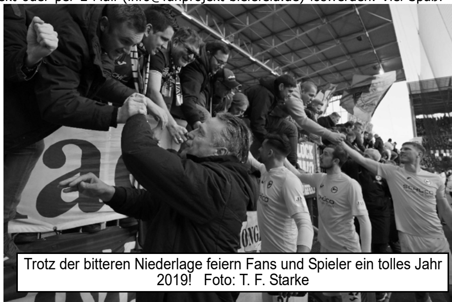
Trotz der bitteren Niederlage feiern Fans und Spieler ein tolles Jahr 2019!

Wenn man als Spitzenreiter aus der Winterpause zurückkehrt, sind die Erwartungen zunächst eindeutig: Dieser Platz an der Sonne muss gehalten werden! Die "Schwächephase" des DSC vor der Winterpause, wo man nur zwei Punkte aus drei Spielen verbuchen konnte, wurde von der Konkurrenz auf äußerst fahrlässige Weise nicht genutzt. So wird es aber nicht weiter gehen, daher muss heute im Westfalenderby gegen den VfL Bochum der Bock umgestoßen werden: Es müssen mehr Heimsiege her! An der Motivation wird es heute sicherlich nicht mangeln, denn das Team weiß wie wichtig ein Erfolg in diesem Spiel ist. Das Trainingslager in Benidorm hat hoffentlich den Grundstein gelegt für ein weiteres herausragendes Jahr. Wenn wir die Methaper weiter führen, wären Heimsiege die tragenden Säulen des Erfolgs. In diesem Sinne: Auf drei Punkte und den Derby-Sieg!