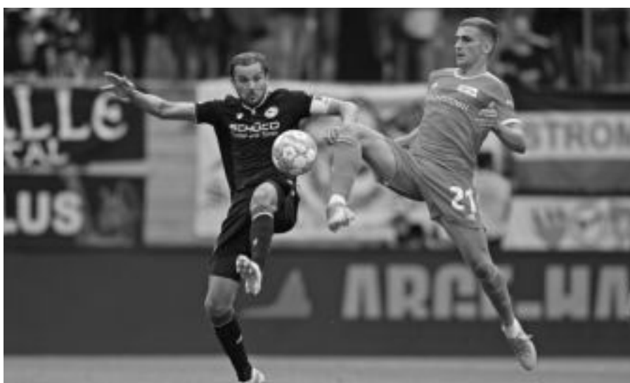
Auch in Berlin: Der Ball findet nicht den Weg ins Tor

In der 88. Minute das alles entscheidende Tor zu kassieren, ist immer großer Mist. So wie am letzten Samstag bei Union Berlin. Erneut hatte der DSC ein Spiel abgeliefert, welches zu weiten Teilen auf Augenhöhe mit dem Gegner stattgefunden hat. Sahen die rund 11.000 Zuschauer in der ersten Halbzeit noch Vorteile für die Eisernen, konnten die Schwarz-Weiß-Blauen im zweiten Abschnitt mit einigen guten Chancen aufwarten und hätten auch in Führung gehen können. Wie man jetzt weiß, müssen, denn wenn man keine Bude macht, kann es eben passieren, soviel Binsenweisheit muss sein, dass man mit leeren Händen die Heimreise antritt. Nun kommt mit Bayer 04 Leverkusen eine Mannschaft, die gut in die Saison gestartet ist und nur zwei ihrer sechs Spiele nicht gewonnen hat; darunter ein 1:1 in der Alten Försterei. Das sollte der Kramer-Elf doch Mut machen, auch gegen Bayer bestehen zu können, vor allem, wenn endlich mal die olle Pille den Weg ins gegnerische Tor findet. Also, auf geht's, Arminia...!