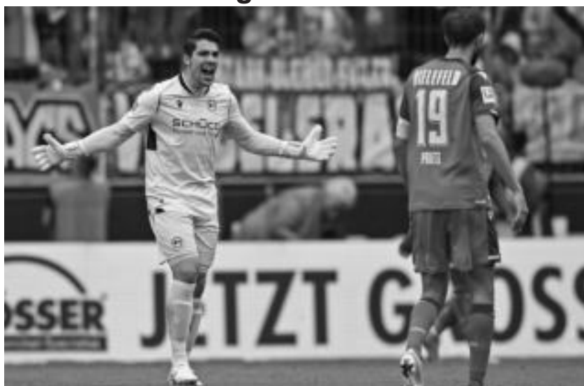
Es ist zum Schreien. Auch in Köln wollte es nichts werden mit Zählbarem. Die Luft wird immer dünner...